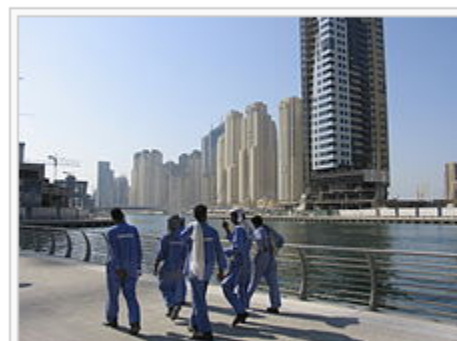
ドバイの住民の多くを占める南アジア人労働者たちは、建設業を主に数多の業種に携わる。