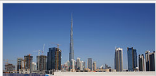
世界で最も高い建造物であるブルジュ・ハリーフ

21世紀に入る頃には、従来からの近代化の波を経て、中東における貿易・商業の最大の中心地と呼ばれるまでのメトロポリスに変貌していた。